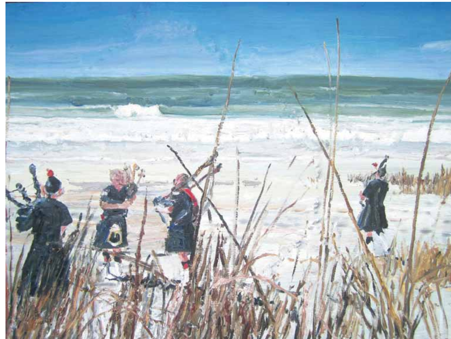
Ana Maria Island, Florida , 2010 huile sur métal/oil on metal 91.4 × 121.9 cm/36" × 48"