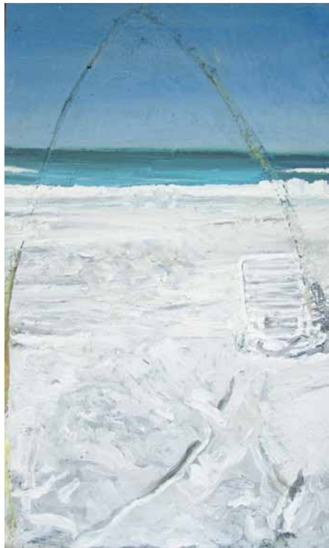
Beach at Harrington House, 2010 huile et cire d'abeille sur construction de bois et masonite/ oil and beeswax on masonite and wood construction 94 × 55.9 cm / 37" × 22"