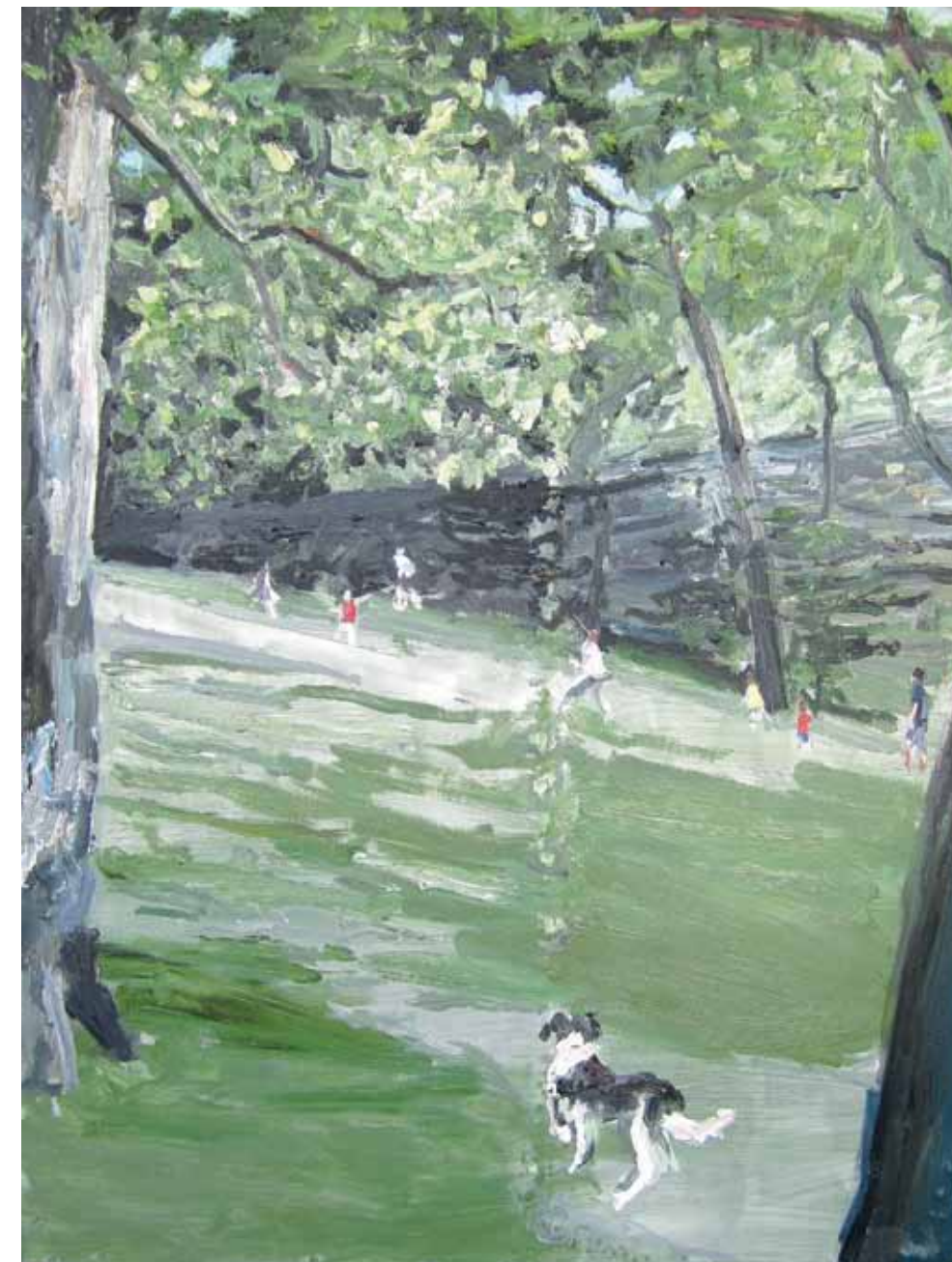
> Park at The Cloisters, New York, 2010 huile sur metal et construction de bois/ oil on metal and wood construction 121.9 × 91.4 cm / 48" × 36"