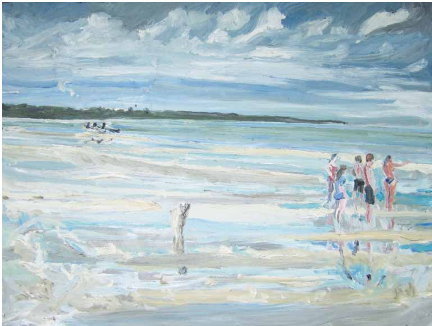
East Cape Receding , 2010 huile sur métal/oil on metal 91.4 × 121.9 cm/36" × 48"