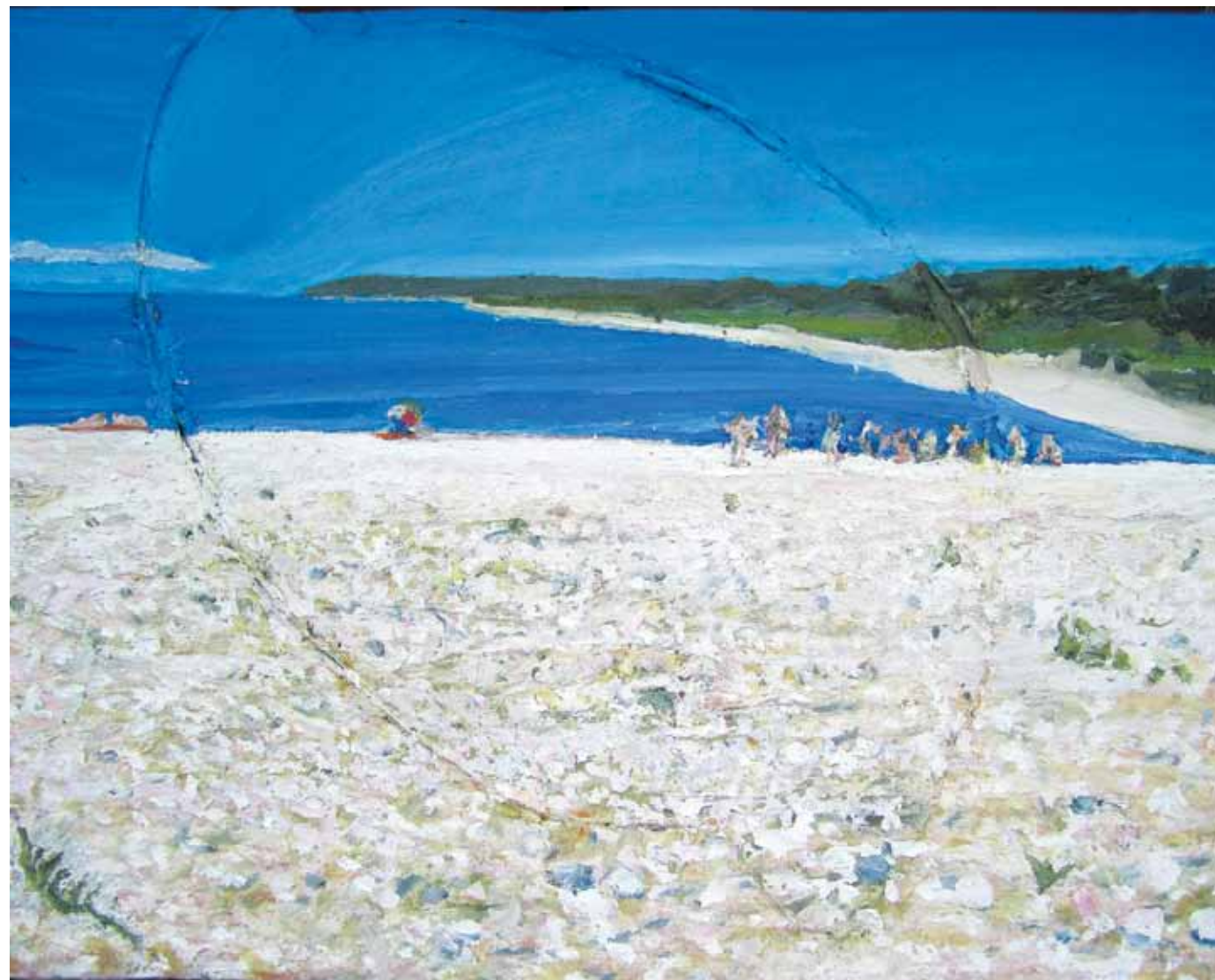
Beach at North Fork, Long Island, 2010 huile sur metal et construction en plexiglass/ oil on metal and plexiglass construction 88.9 × 114.3 cm / 35" × 45"