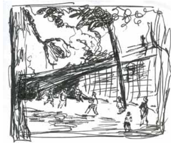
Étude pour / Study for Park at the Cloisters , 2009 Encre sur papier / ink on paper 15.24 × 10.16 cm / 6" × 4"

Palm Springs, Florida , 2010 huile sur laiton / oil on brass 34.5 × 121.9 cm / 13.6" × 48"